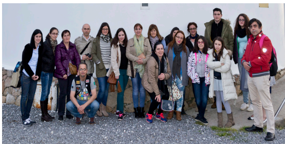
Los participantes se repartieron en varios grupos y días. Estos viajaron desde Santiago.