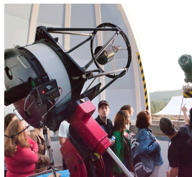
Máxima atención para saber cómo se orienta el telescopio.