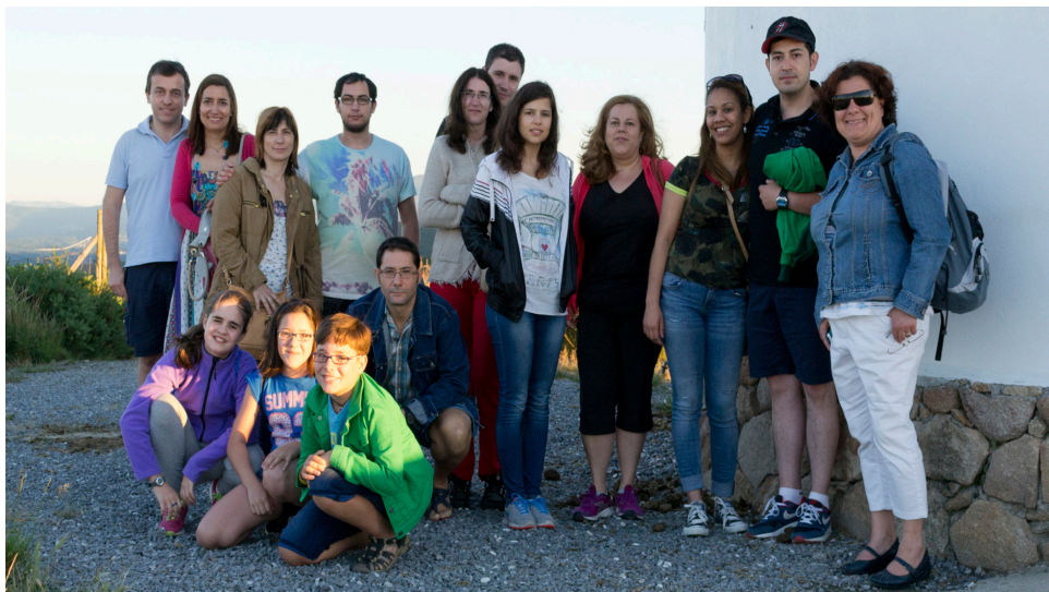
El grupo de ourensanos, en la finca exterior de 10.000 metros cuadrados.