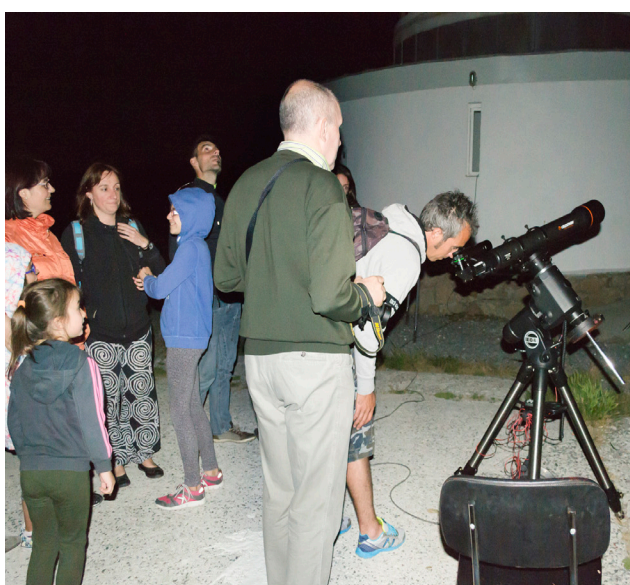
Las altas prestaciones del telescopio ayudan a ver mejor.