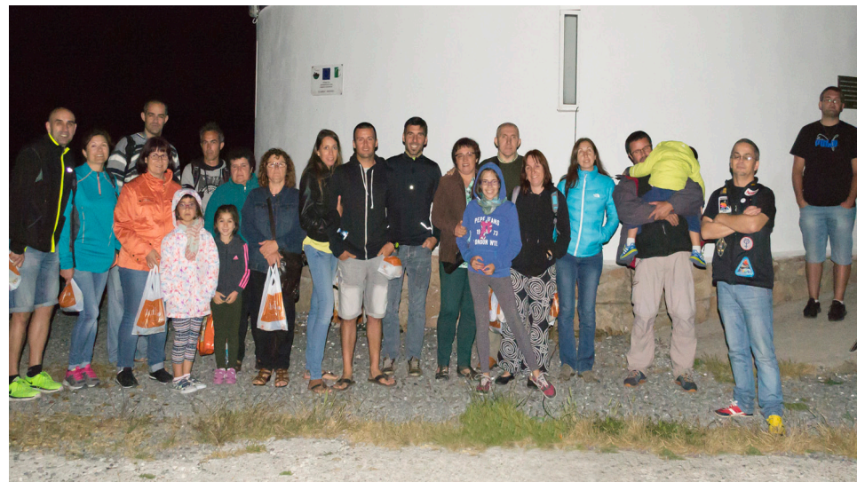
El grupo de Porriño comprobó la excelente visibilidad y calidad del cielo de la zona.